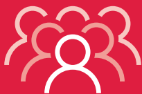
Tableau généalogique dématérialisé